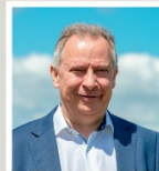
Eine Stimme für unseren langjährigen Landrat Stephan Pusch aus Hückelhoven (hellblauer Wahlzettel)

Die Direktkandidatinnen und -kandidaten für den Gemeinderat, vorgestellt auf Seite 2, wählen Sie mit der vierten Stimme (hellgrüner Wahlzettel)