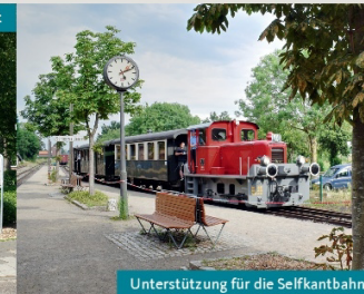
Unterstützung für die Selkantbahn

Mit vollem Einsatz werden wir weiter am Erhalt und der Verbesserung unserer Strukturen arbeiten. Unsere Mischung für Gangelt besteht aus jungen und erfahrenen Frauen und Männern, denen die Zukunft unserer Gemeinde am Herzen liegt. Nur mit Ihrer Stimme können wir unsere Ziele für Sie umsetzen.