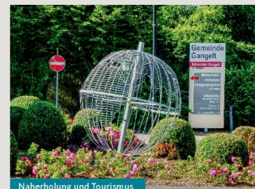
Naherholung und Tourismus