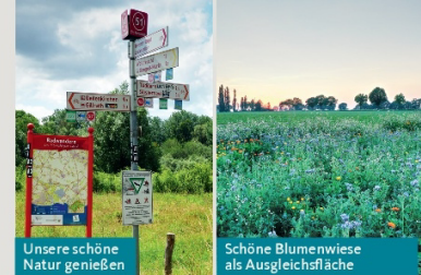
Unsere schöne Natur genießen