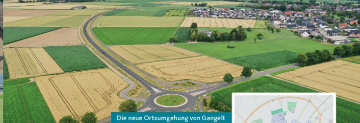
Die neue Ortsumgehung von Gangelt