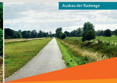
Ausbau der Radwege