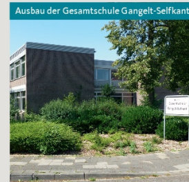
Ausbau der Gesamtschule Gangelt-Selkant