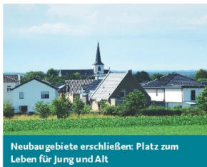
Neubaugebiete erschließen. Platz zum Leben für Jung und Alt